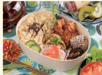
ソイミートから揚げ弁当