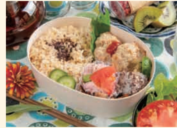
オートミールバーグ弁当