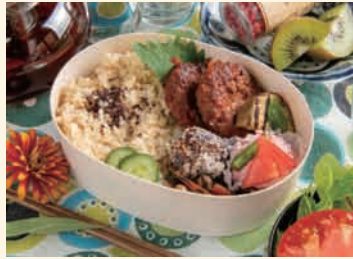
ソイミートバーグ弁当

プラントベースとは 「植物由来のものを多く摂るよう心掛ける」 というカジュアルでポジティブな 考え方のことです。