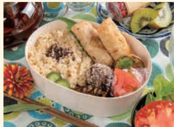
ひよこ豆の春巻き弁当