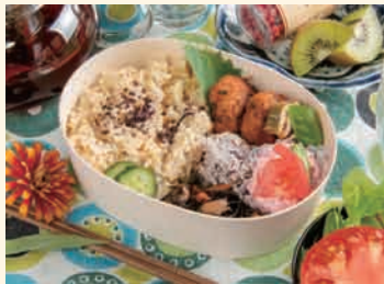
おからナゲット弁当